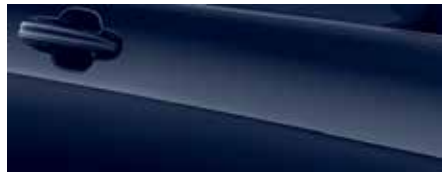
כחול בלייזר (FCR)