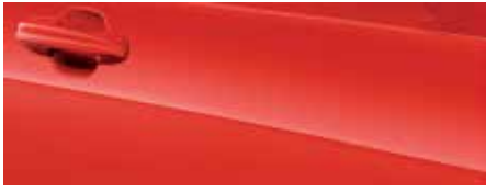
אדום מרוצים (FCZ)