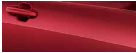
אדום לוחט* (FCF)