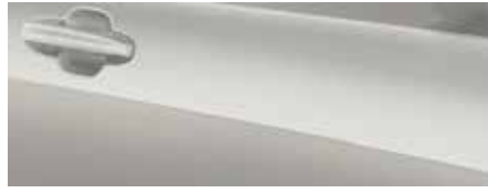
לבן קראמי מטאלי (FCL)