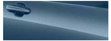
כחול כרום (FCC)