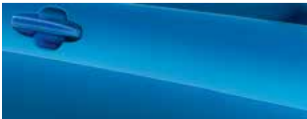
כחול מרוצים (FCI)