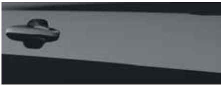
שחור מטאלי (FCA)