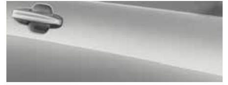
כסף מטאלי (FCO)