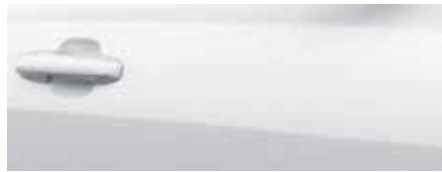
לבן קפוא (FC5)