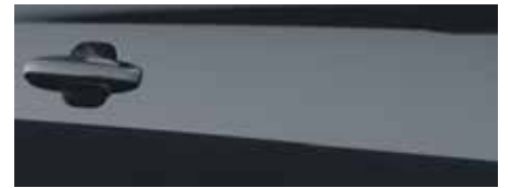
כחול עשיר (FCD)